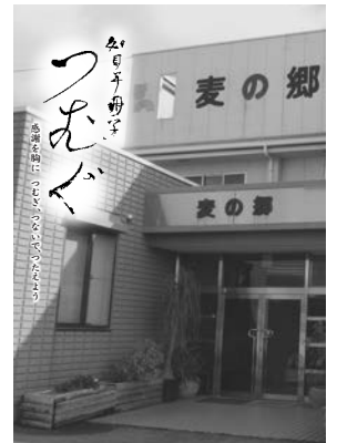
麦の郷 40周年記念CD 「ねがい ありがとう」