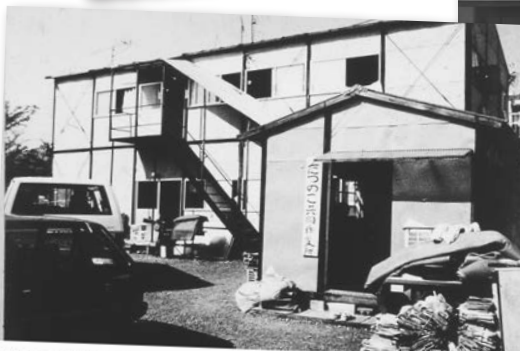
たつのご共同作業所（無認可）1977年